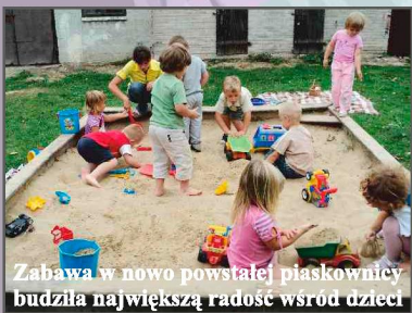
Zabawa w nowo powstałej piaskownicy budziła największą radość wśród dzieci