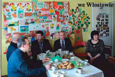
Wizyta przedstawicieli Banku Światowego we Włostowie