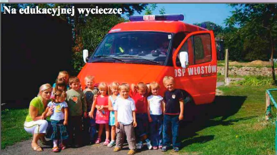
Na edukacyjnej wycieczce