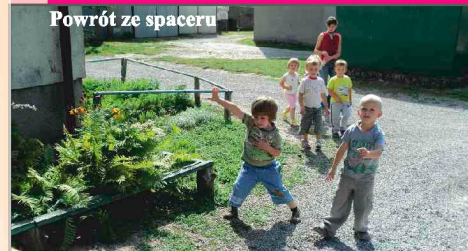
Powrót ze spaceru