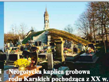
Neogotycka kaplica grobowa rodu Karskich pochodząca z XX w.