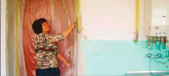
Prace remontowe w pomieszczeniu przeznaczonym na zajęcia dla dzieci

D zięki uzyskanemu wsparciu finansowemu w ramach Programu Integracji Społecznej - Poakcesyjnego Programu Wsparcia Obszarów Wiejskich, a także wkładowi finansowo-osobowo-rzeczowemu członków Stowarzyszenia, jak również dużemu zaangażowaniu lokalnej społeczności, pomieszczenia po dawnej bibliotece zostały przystosowane do prowadzenia zajęć opiekuńczo-educacyjnych. W ramach usługi zostały także przygotowane niewielki plac zabaw dla dzieci. Z pozyskanych środków zakupiono pomoce dydaktyczne oraz zabawki.