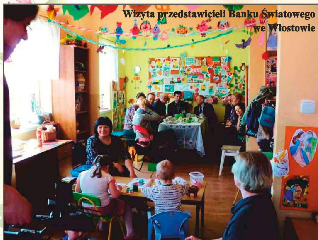
Wizyta przedstawicieli Banku Światowego we Włostowie

przyznało zaszczytny tytuł „Dobrej Praktyki”. Tytuł ten oznaczał również dodatkowe wsparcie finansowe ze strony Programu Integracji Społecznej na kontynuację i upowszechnienie usługi w regionie.