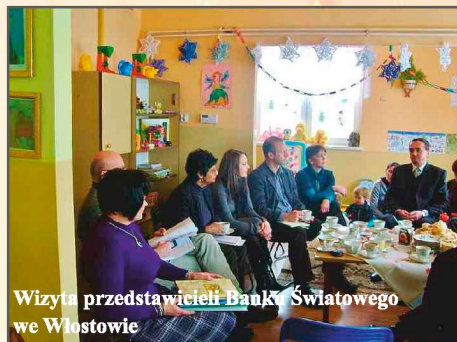
Wizyta przedstawicieli Banku Światowego we Włostowie

Wartość i znaczenie tego przedsięwzięcia zostało docenione przez Ministerstwo Pracy i Polityki Społecznej, które inicjatywie