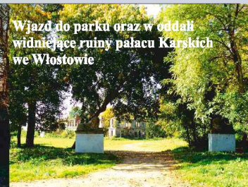
Wjazd do parku oraz w oddali widniejące ruiny pałacu Karskich we Włostowie

Mieszkańcy gminy prowadzą bogate życie kulturalne oraz patriotyczne, inspirowane przez lokalne instytucje samorządowe, kulturalne i organizacje społeczne. Chlubą gminy jest zespół folklorystyczny „Świętokrzyskie Uśmiechy”, który swoimi występami nie tylko uświetnia liczne imprezy lokalne, ale również zajmuje wysokie miejsca na folklorystycznych przeglądach muzycznych w regionie.