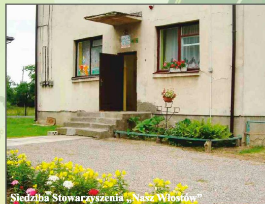
Siedziba Stowarzyszenia „Nasz Włostów”

Stowarzyszenie Wspierania Aktywności Lokalnej "Nasz Włostów" w roku 2009 podjęło się realizacji usługi w ramach Programu Integracji Społecznej, adresowanej do maluchów z terenu Gminy Lipnik. Potrzeba realizacji przedsięwzięcia wygenerowana była m.in. przez problem bezrobocia w gminie.