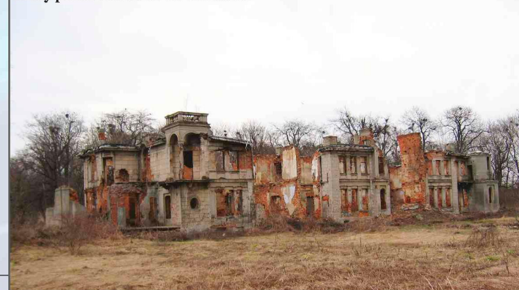
Ruiny pałacu Karskich we Włostowie

„Adaptacja pomieszczeń OSP w Lipniku dla celów kulturalno - oświatowych” finansowana z Sektorowego Programu Operacyjnego, w ramach programu Restrukturyzacji i Modernizacji Sektora Żywnościowego oraz Rozwoju Obszarów Wiejskich oraz „Prze-