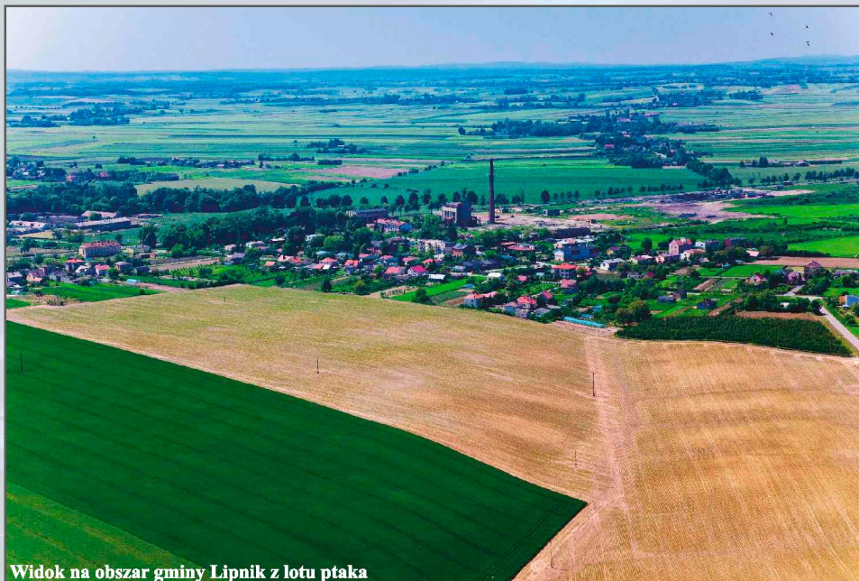
Widok na obszar gminy Lipnik z lotu ptaka

Gmina Lipnik cieszy się sporą liczbą ciekawych i atrakcyjnych pod kątem historycznym miejsc. Będąc tu w szczególny sposób należy zwrócić uwagę na zabytki w miejscowościach Leszczków, Międzygórz, Malice Kościelne oraz Włostów.