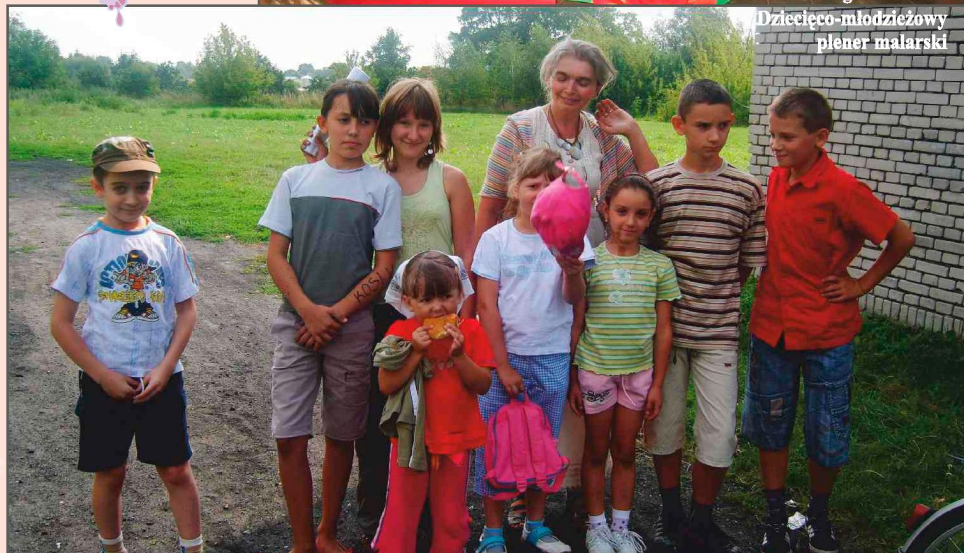
Dziecięco-młodzieżowy plener malarski