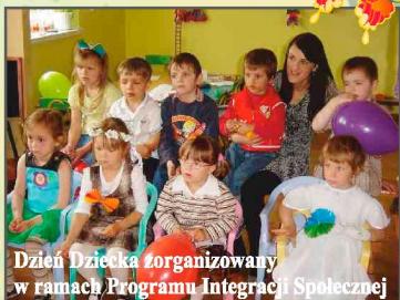
Dzień Dziecka zorganizowany w ramach Programu Integracji Społecznej