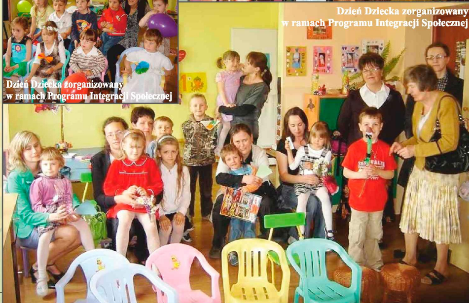
Dzień Dziecka zorganizowany w ramach Programu Integracji Społecznej