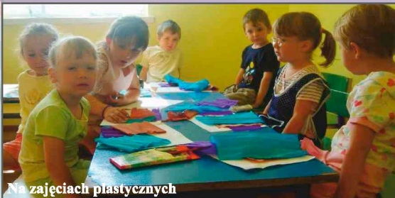
Na zajęciach plastycznych