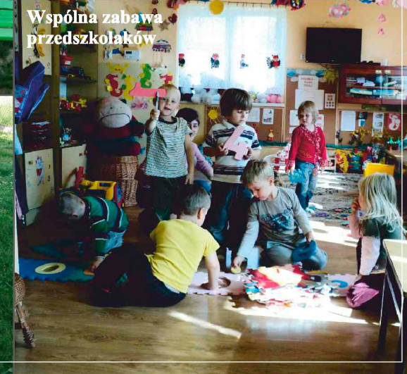
Wspólna zabawa przedszkolaków