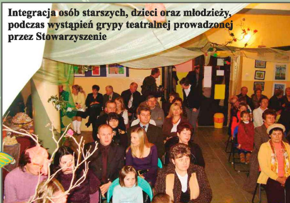
Integracja osób starszych, dzieci oraz młodzieży, podczas wystąpień grypy teatralnej prowadzonej przez Stowarzyszenie

botne nie mają możliwości uczestniczenia w procesie poszukiwania pracy i aktywizacji zawodowo – społecznej. Wpływa to na m.in. długotrwałe bezrobocie, znaczne ubożenie rodzin, jak również wyłączenie z życia społecznego miejscowości czy gminy”.