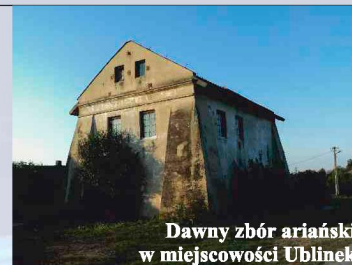
Dawny zbór ariński w miejscowości Ublinek