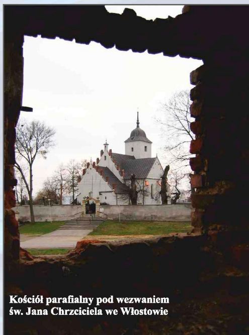
Kościół parafialny pod wezwaniem św. Jana Chrzciciela we Włostowie