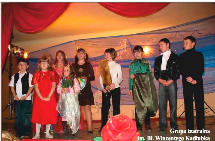
Grupa teatralna im. Bł. Wincentego Kadłubka