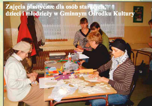
Zajęcia plastyczne dla osób starszych, dzieci i młodzieży w Gminnym Ośrodku Kultury

„(...) Wiedzieliśmy, że istnieje znaczny odsetek osób bezrobotnych nieuprawnionych do otrzymywania zasiłku z tego tytułu. Fakt ten negatywnie wpływał na możliwości rozwojowe i funkcjonalne rodziny, jako komórki odpowiedzialnej za wychowanie i edukację potomstwa. Uznaliśmy, że potrzeba opieki nad dzieckiem i brak środków finansowych powoduje, iż osoby bezro-