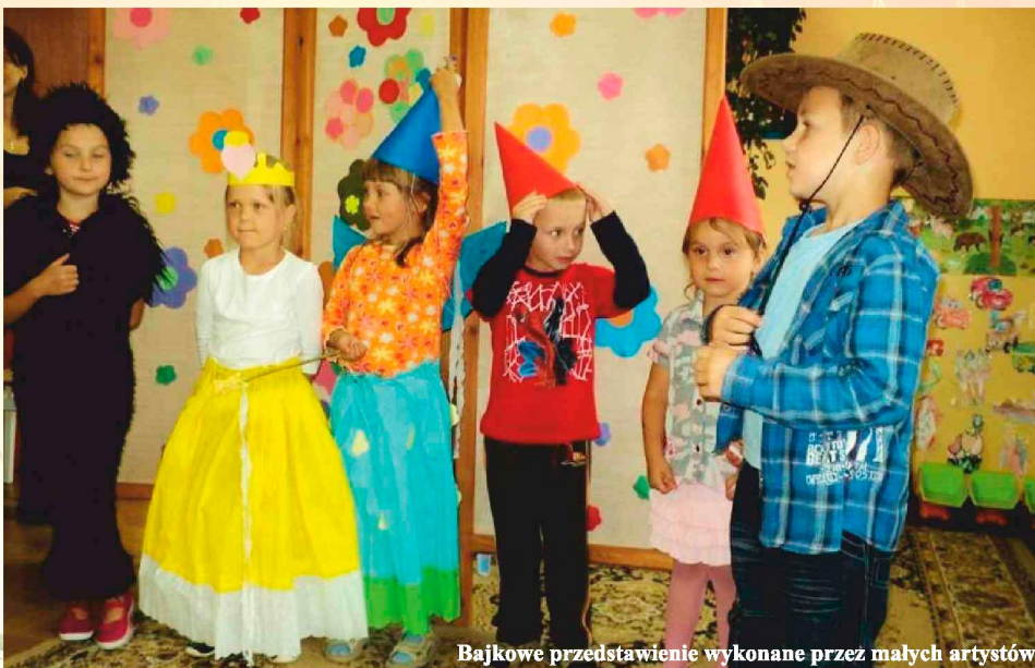
Bajkowe przedstawienie wykonane przez małych artystów

Fot1. Mali przyjaciele. Fot2. Powrót ze spaceru. Fot3i 4. Tutaj bez opisu (zdj z psem i na ławce) Fot4. Wspólna zabawa przedszkolaków.