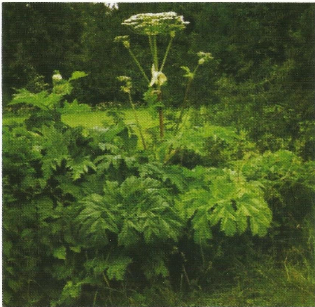
Fot. 1. Kwitnąca roślina barszczu Sosnowskiego