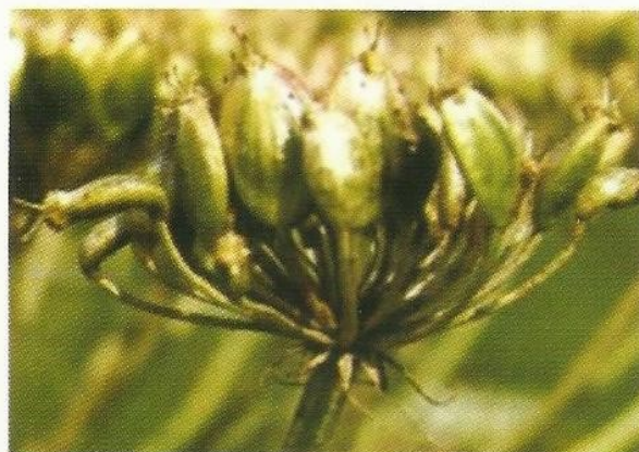
Fot. 5. Baldaszek z dojrzewającymi rozłupkami (nasionami)

Ulotka nie jest przeznaczona do celów komercyjnych