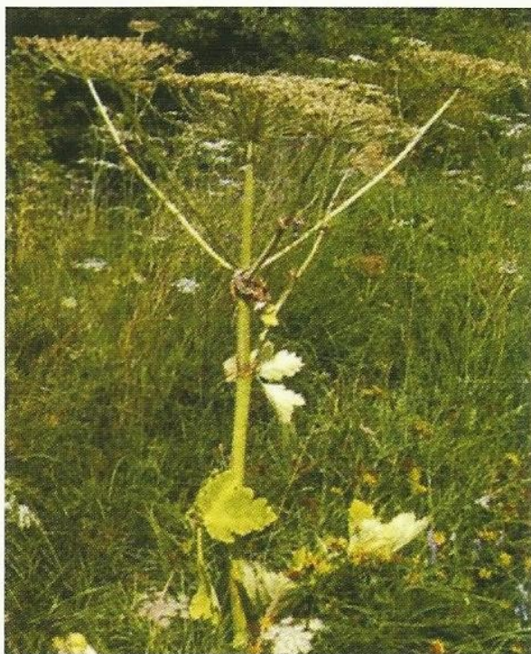
Fot. 4. Pęd z dojrzewającymi baldachami (rozłupkami)