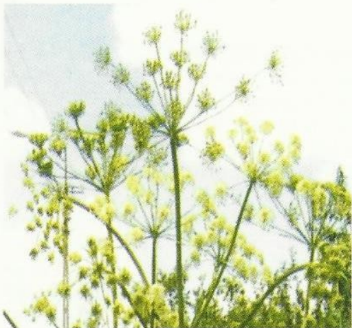
Fot. 2. Kwitnące baldachy